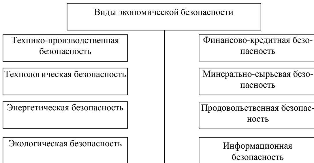
Рисунок 1 – Виды экономической безопасности

арабскими цифрами сквозной нумерацией по всей работе. Каждый рисунок (схема, график, диаграмма) обозначается словом «Рисунок», должен иметь заголовок и подписываться следующим образом – посередине строки без абзацного отступа, например: